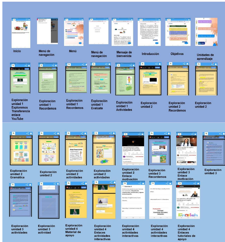
Figura 2. Diseño de Software y programación App EWBE

Nota. Aplicación móvil como estrategia pedagógica para el fortalecimiento de la habilidad escritora del inglés en estudiantes de grado noveno (p.121), por Melo P. (2021).