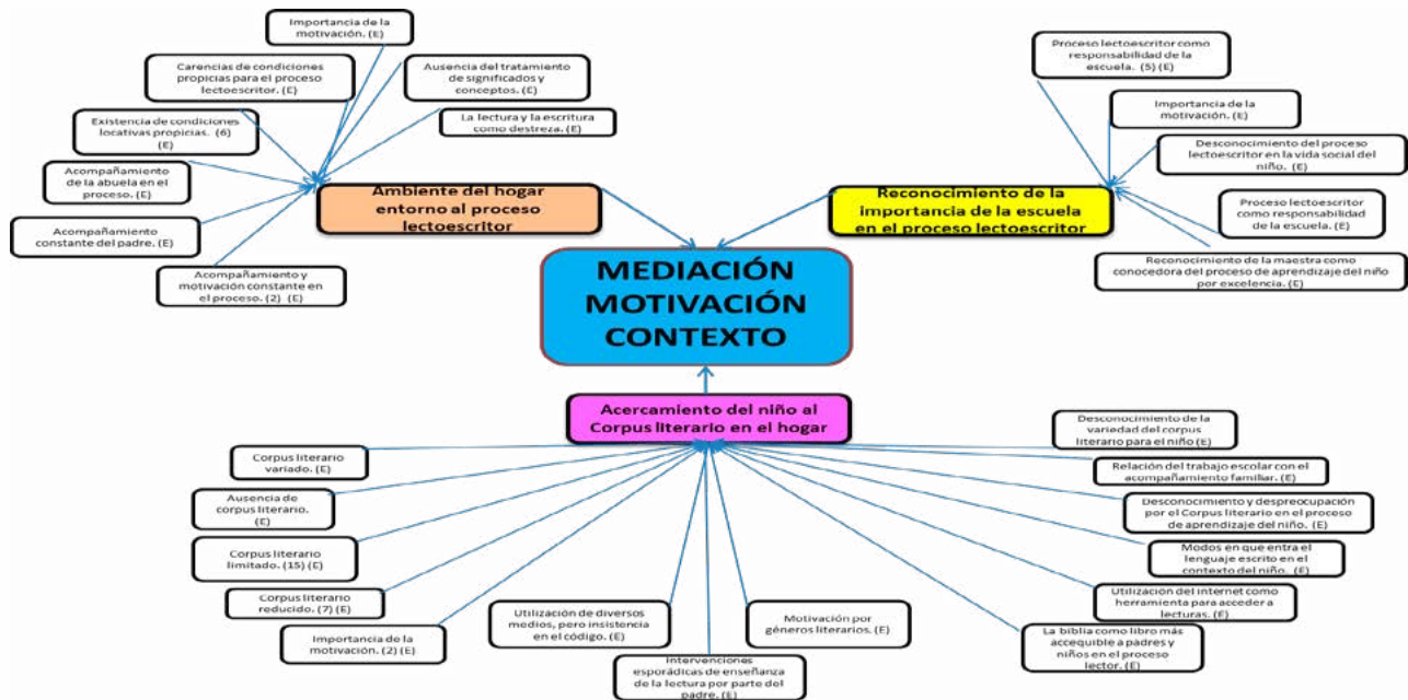
Figura 1. La mediación, la motivación y el contexto en el proceso lectoescriptor – Ambiente del hogar y el corpus literario.

Se abordarán en este espacio, los procesos de mediación y motivación llevados a cabo por las madres, los cuales terminarán construyendo un mapa del contexto familiar que evidenció las condiciones de su influencia en el proceso lectoescriptor.